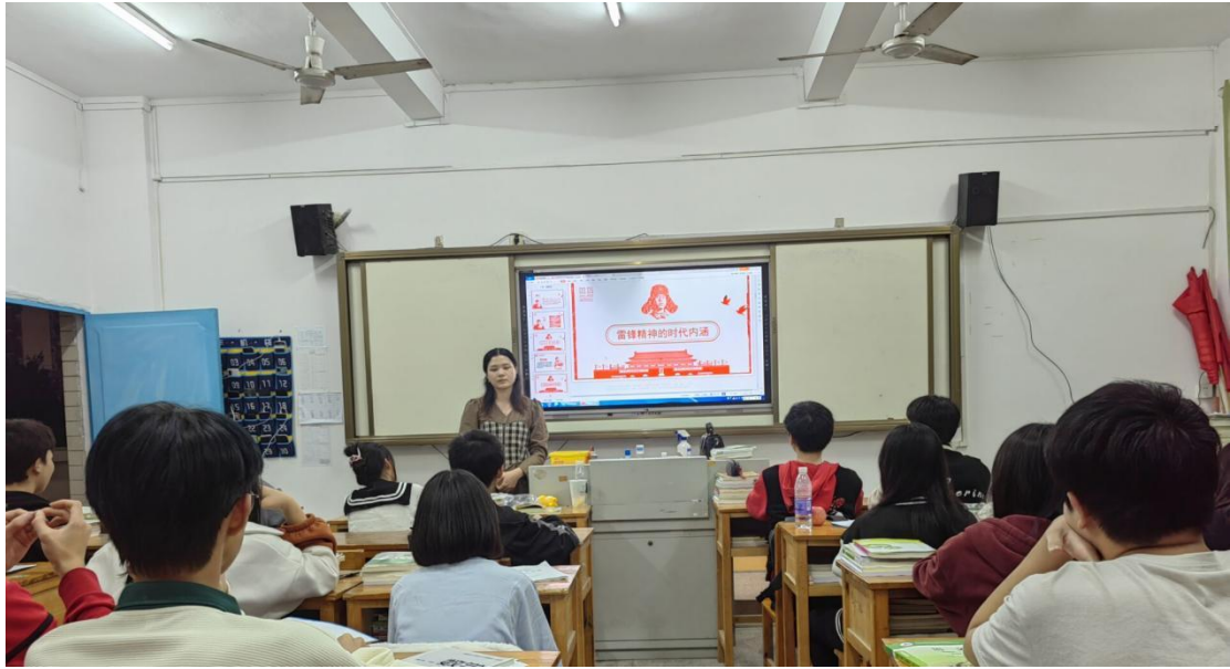
图 13：主题班会活动照片