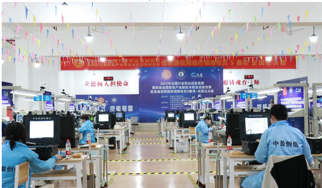
图 15：2023 年全国行业职业技能竞赛第四届全国信息产业新技术职业技能竞赛信息通信网络终端维修员 S（智能电子产品检测与数据恢复方向）职业技能竞赛全国总决赛现场