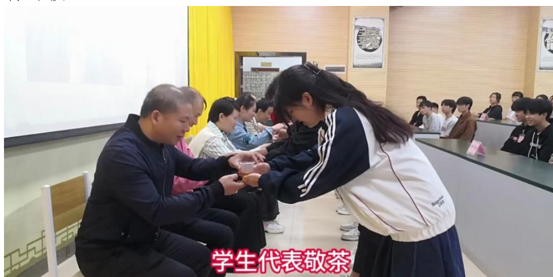
图 6：学生向班主任教师行尊师礼

着力培养有健全人格、有社会责任感、有创新精神的高技能人才。坚持传承与发扬中华优秀传统文化，年内开办《道德讲堂》教师组培训 1 期、学生组培训 22 期，9 年来开办 150 多期《道德讲堂》，对新生与新进教师开展以五伦八德为主要内容的传统文化教育，践行社会主义核心价值观。坚持每周安排 2 天早读思政与传统文化内容。强化校园文化建设，发挥学校“三风一训”的导向作用，培养学生良好的德行习惯。