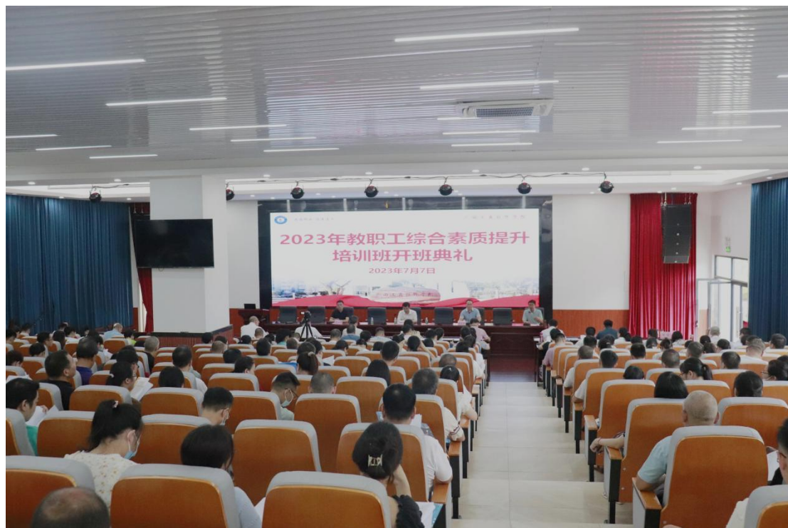
图 22: 2023 年 7 月在学校组织全体教职工综合能力培训班

级讲师 1 名)、讲师 19 名、高级技师 8 名、技师 9 名; 建成校级技能大师工作室 5 个、名师工作坊 2 个, 充分发挥工作室(坊)团队引领、带动、辐射作用。