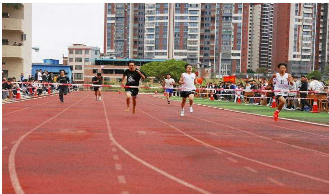
图 8：学生校运会田径项目活动照

校学生开展心理健康调查 1 次，并聘请校外专家进校开展专题讲座 5 场，常态化对学生开展心理健康辅导 20 次。