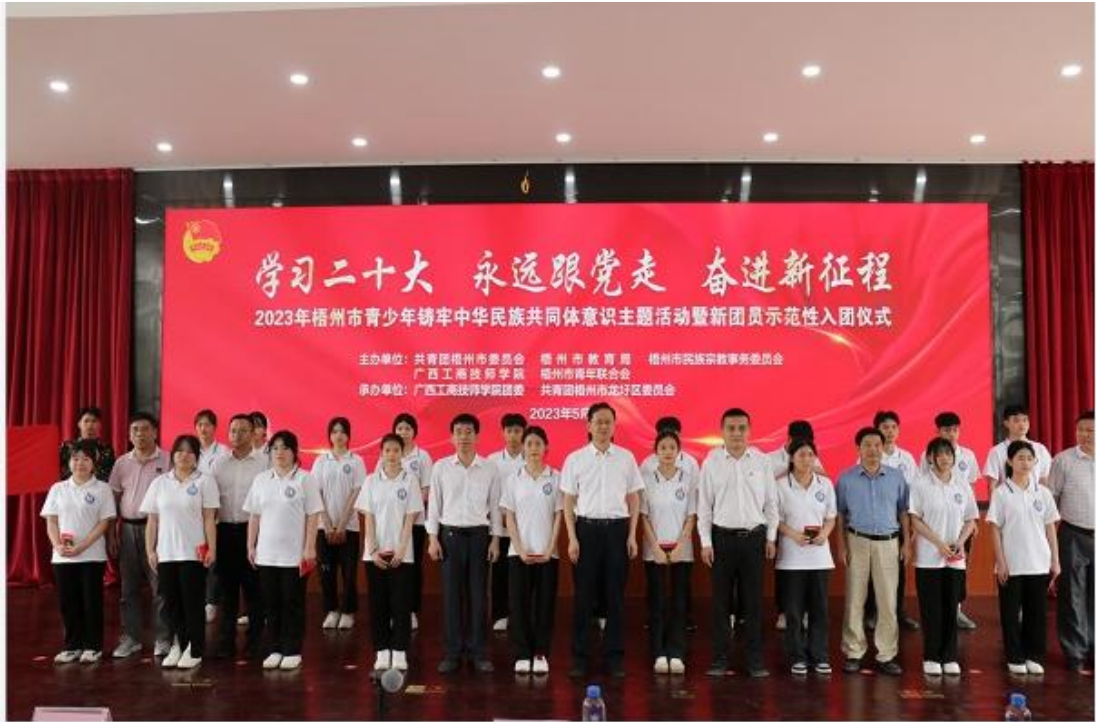
图 4：承办线上新疆克拉玛伊市与广西梧州市青少年铸牢中华民族共同体意识主题活动暨新团员示范性入团仪式活动