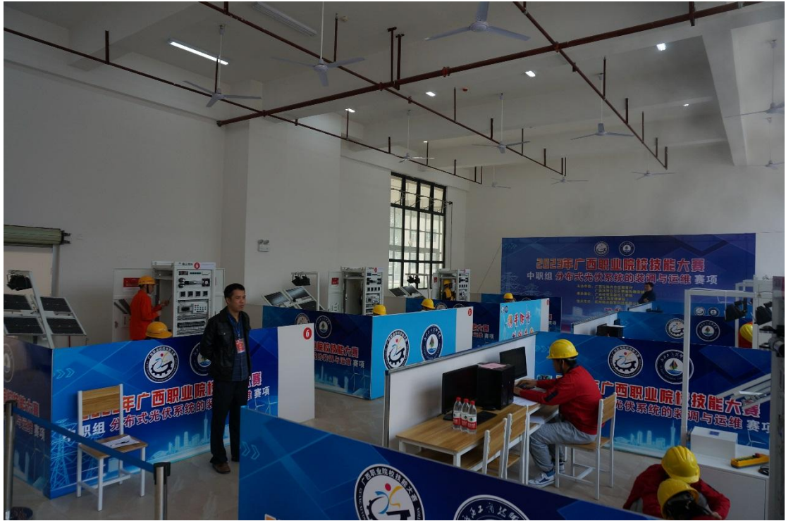
图 16：2023 广西职业院校技能竞赛“分布式光伏系统的装调与运维”赛项现场