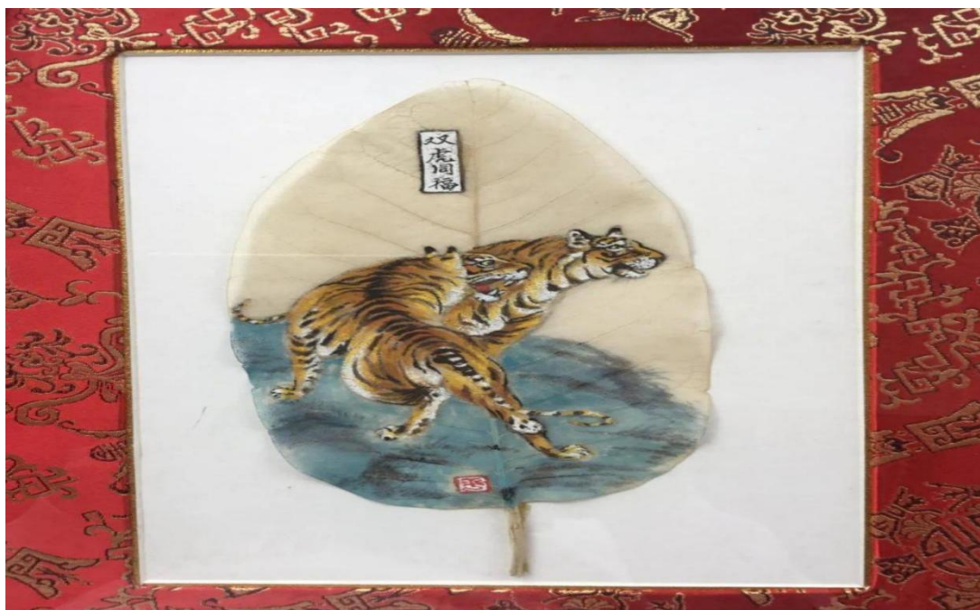
图 19：学生叶脉画作品《双虎同福》