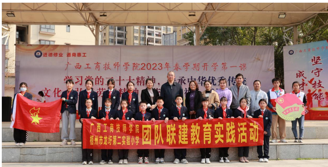
图 18：龙圩二实小的少先队员到我院参加职业启蒙教育活动大合照