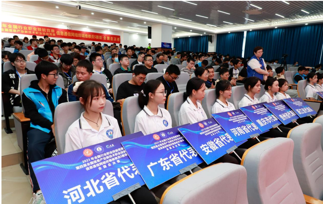
图 14：2023 年全国行业职业技能竞赛第四届全国信息产业新技术职业技能竞赛信息通信网络终端维修员 S（智能电子产品检测与数据恢复方向）职业技能竞赛全国总决赛开幕式

人次；广西一等奖 5 项 7 人次，二等奖 11 项 22 人次，三等奖 22 项 36 人次。