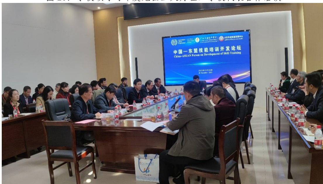
图 21：学校领导参加广西-东盟技能培训开发论坛