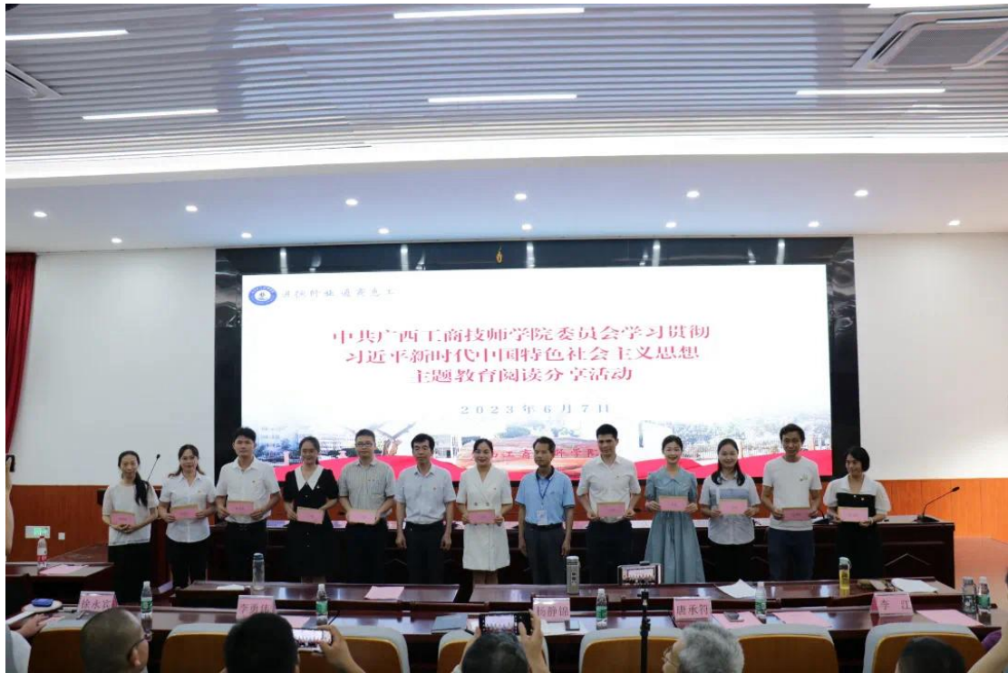
图 2：开展贯彻习近平新时代中国特色社会主义思想主题教育阅读分享活动