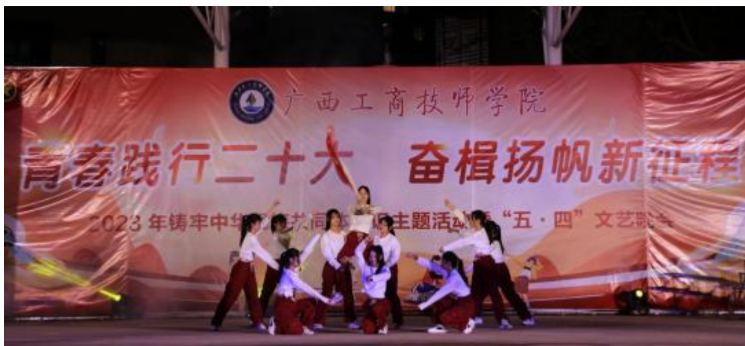
图 10：学生文艺晚会表演现代舞《霍元甲》