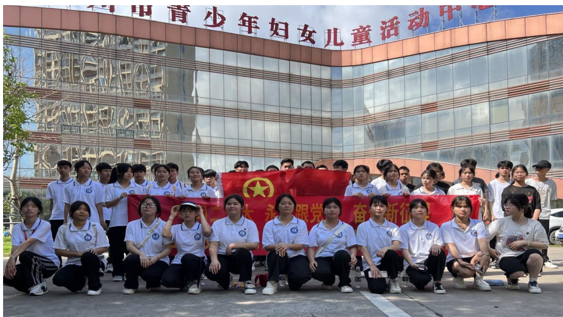
图 17：我院团员代表研学活动合影