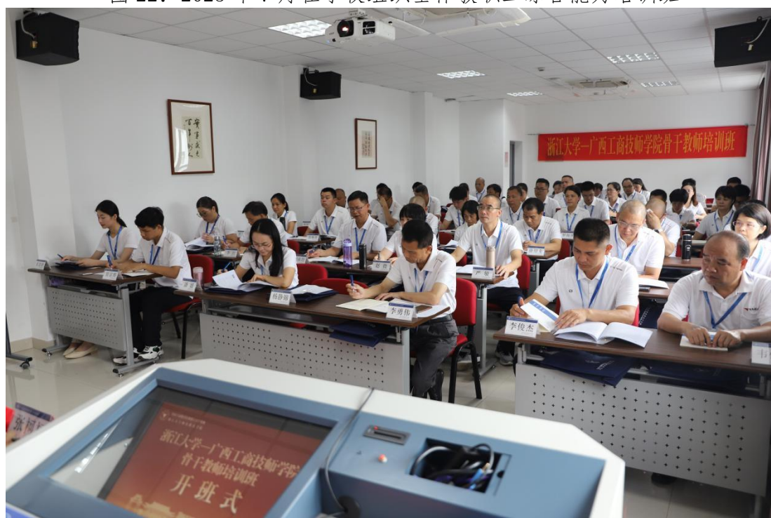
图 23: 2023 年 8 月组织部分骨干教师到浙江大学培训