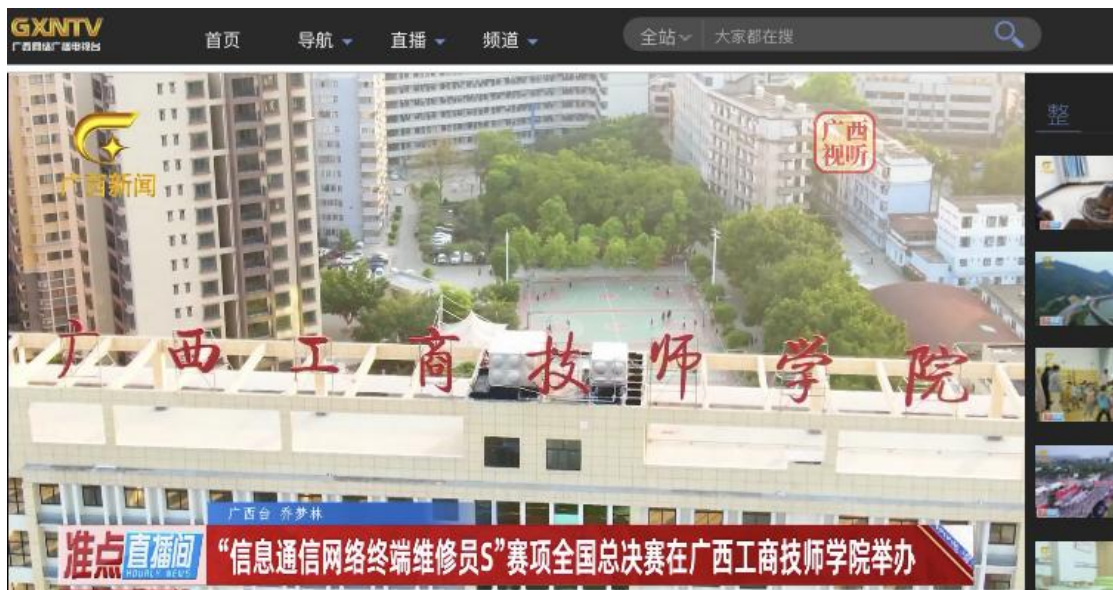
图 5：广西新闻对学校承办赛事的报道