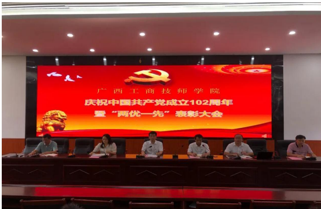
图 3：开展庆祝中国共产党成立 102 周年暨“两优一先”表彰大会