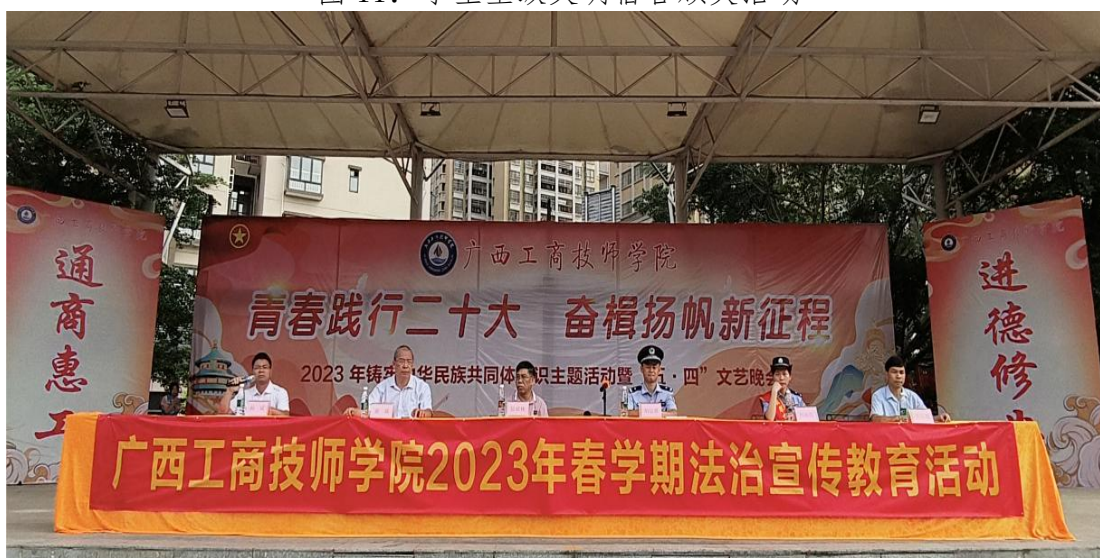
图 12：2023 年春学期法制宣传教育活动