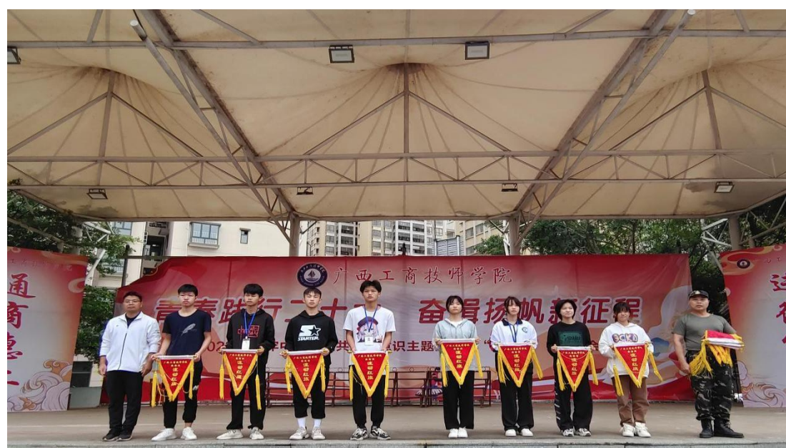
图 11：学生星级文明宿舍颁奖活动