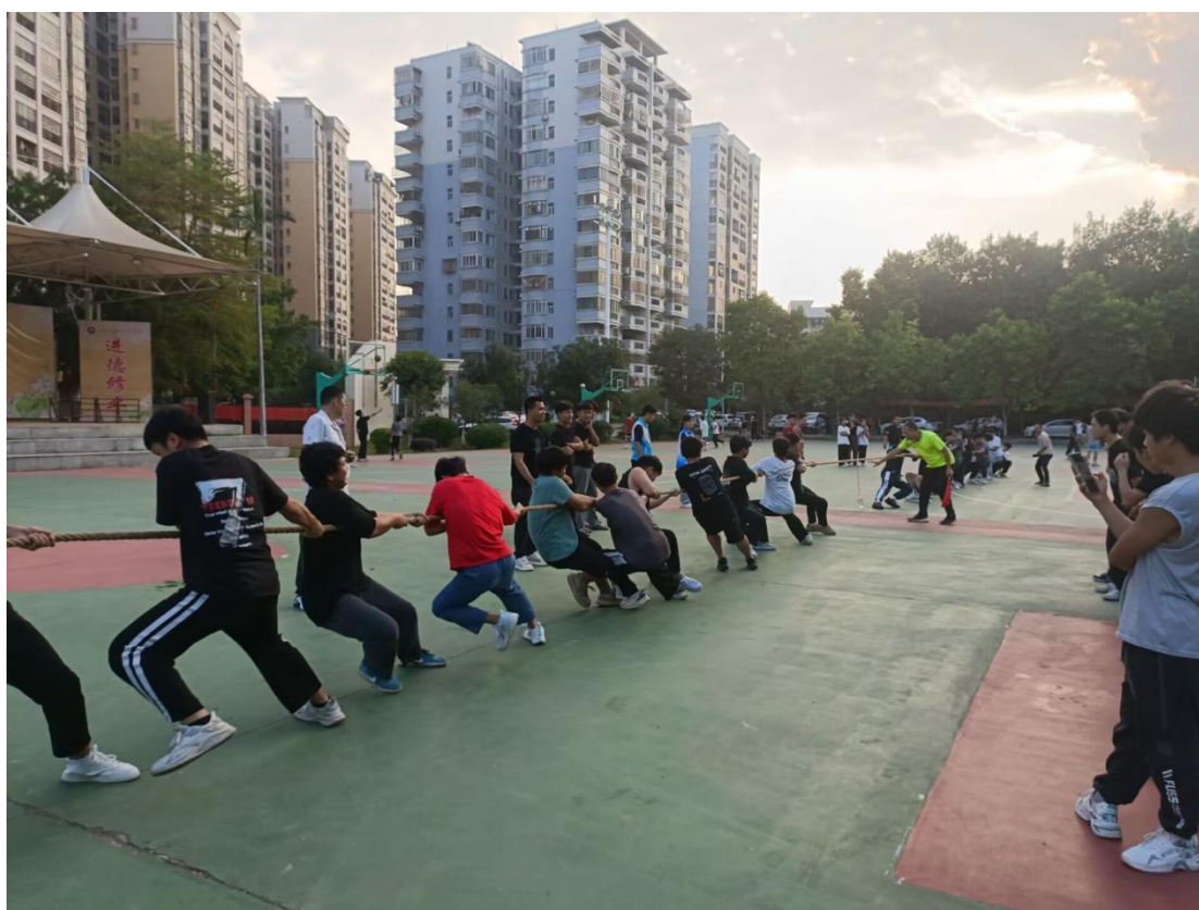
图 9：学生校运会拔河项目活动照