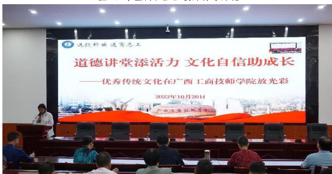
图 7：传统文化培训后心得分享会