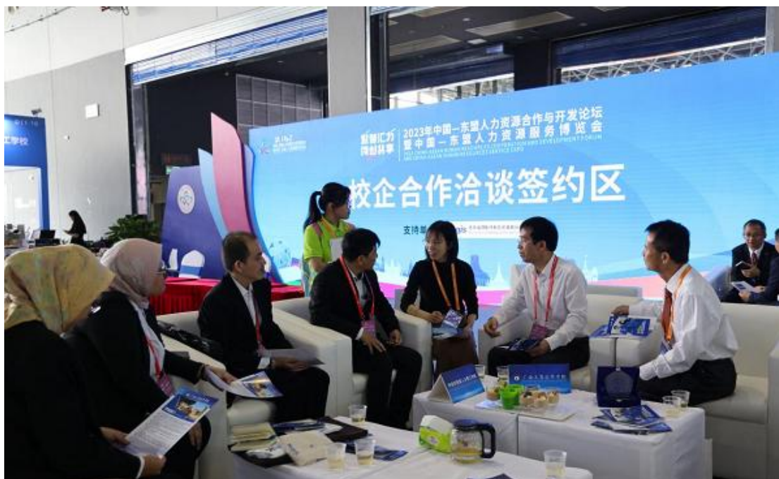
图 20：学校领导与印度尼西亚人力理工学校代表合作洽谈